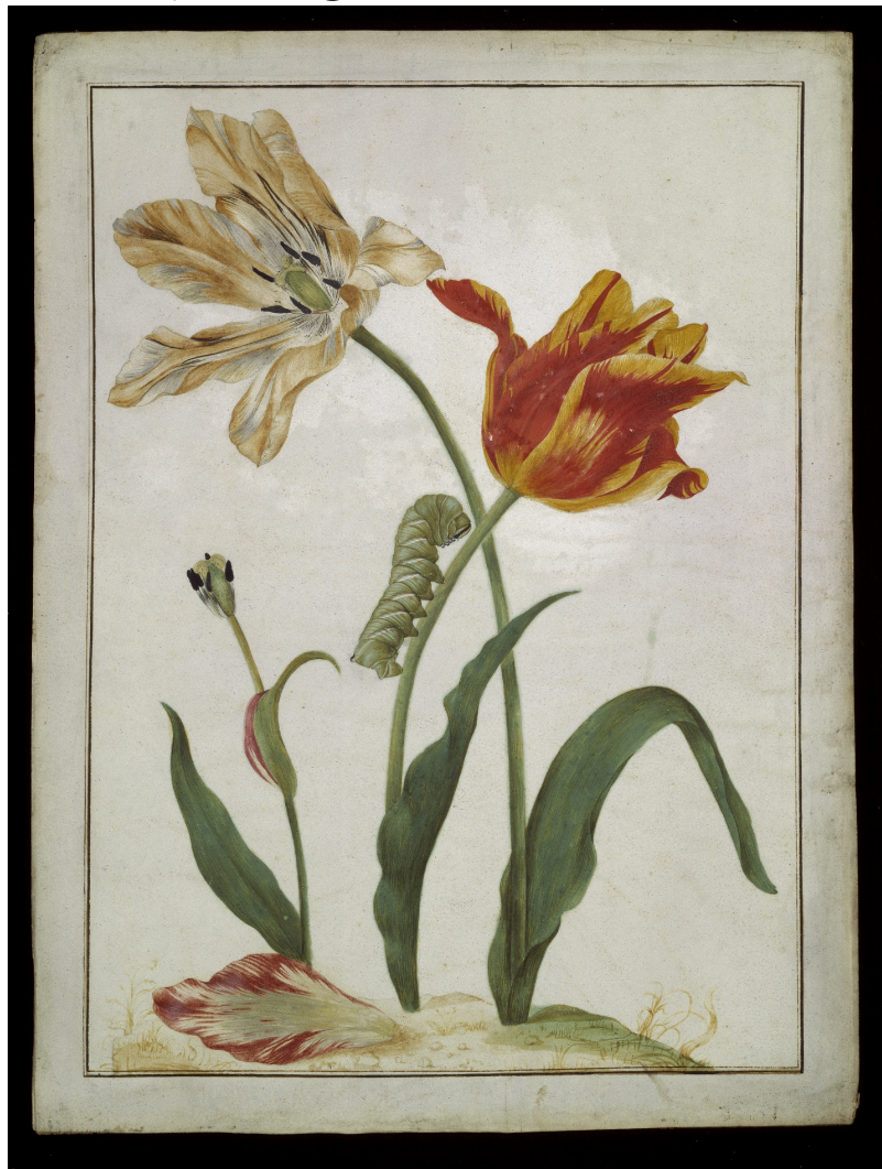
Eksempel på Merian tegning.