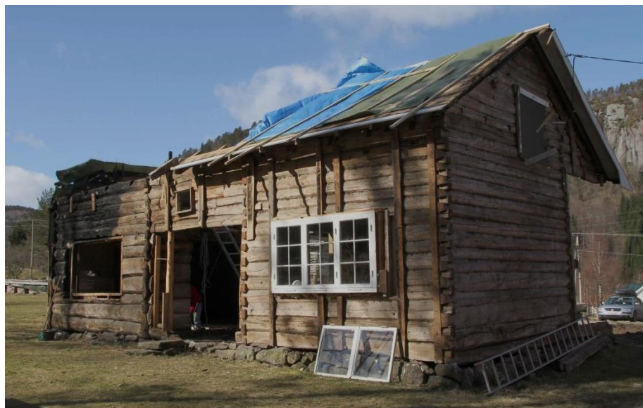
Trækonstruktion i Våningshus.