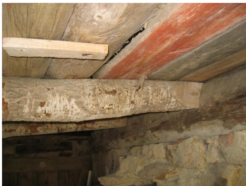
Detaljer fra loftet i det nordre rum "sauestillet"