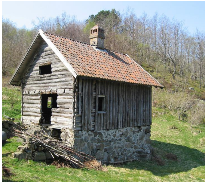
Bryggerhuset på Vimmervåg , Hidra. Foto: Inger Vågen 2006.

af Birgitte Wendelbo Arentoft og Claudia Baittinger