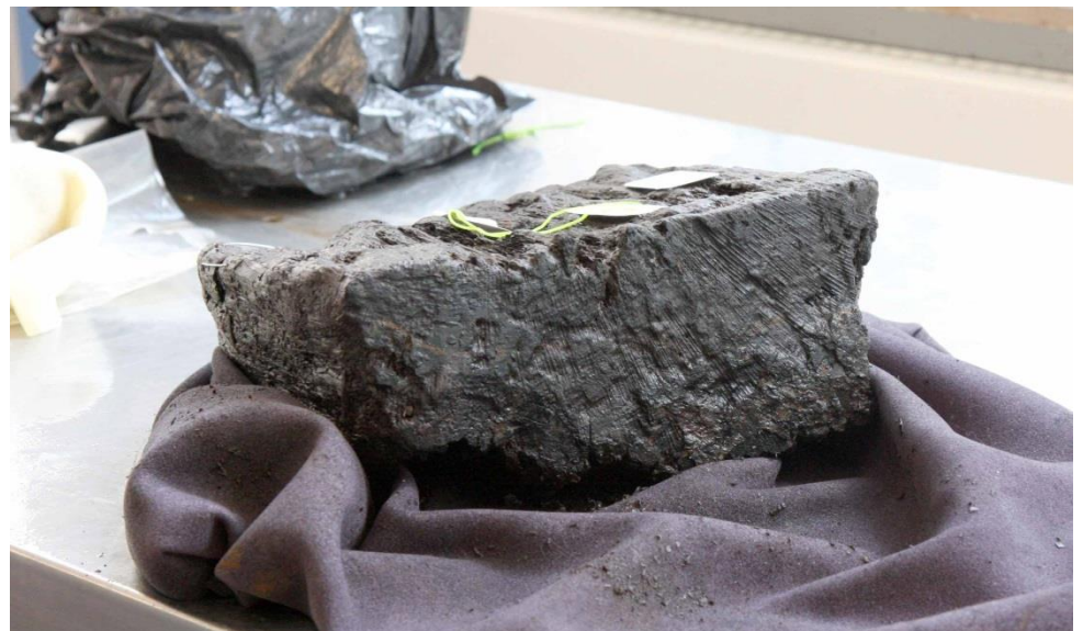
Rest af stolpe fra palisade. Underside.

Resultatet kan frit anvendes ved henvisning til denne rapport. Kontakt evt. laboratoriet for yderligere oplysninger mm. Rapporten kan endvidere lastes ned fra hjemmesiden www.nnu.dk , under Dendrokronologi, Rapporter.