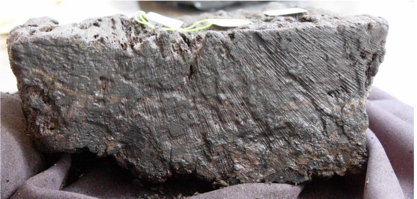
Rest af stolpe fra palisade. Underside.

\A5516 Jelling\Smededam\6006801a.d Title : A5516 Jelling Smededam lodret planke x13 Raw Ring-width QUSP data of more than 62 years length 0 sapwood rings and no bark surface