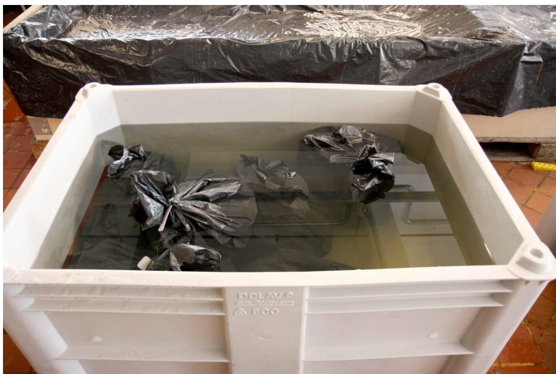
Rester fra palisadevæg pakket i plastikposer og sænket i vandbad på Nationalmuseets Bevaringsafdeling

Nationalmuseet Forskning og Formidling Danmarks Oldtid - Naturvidenskab Dendrokronologi