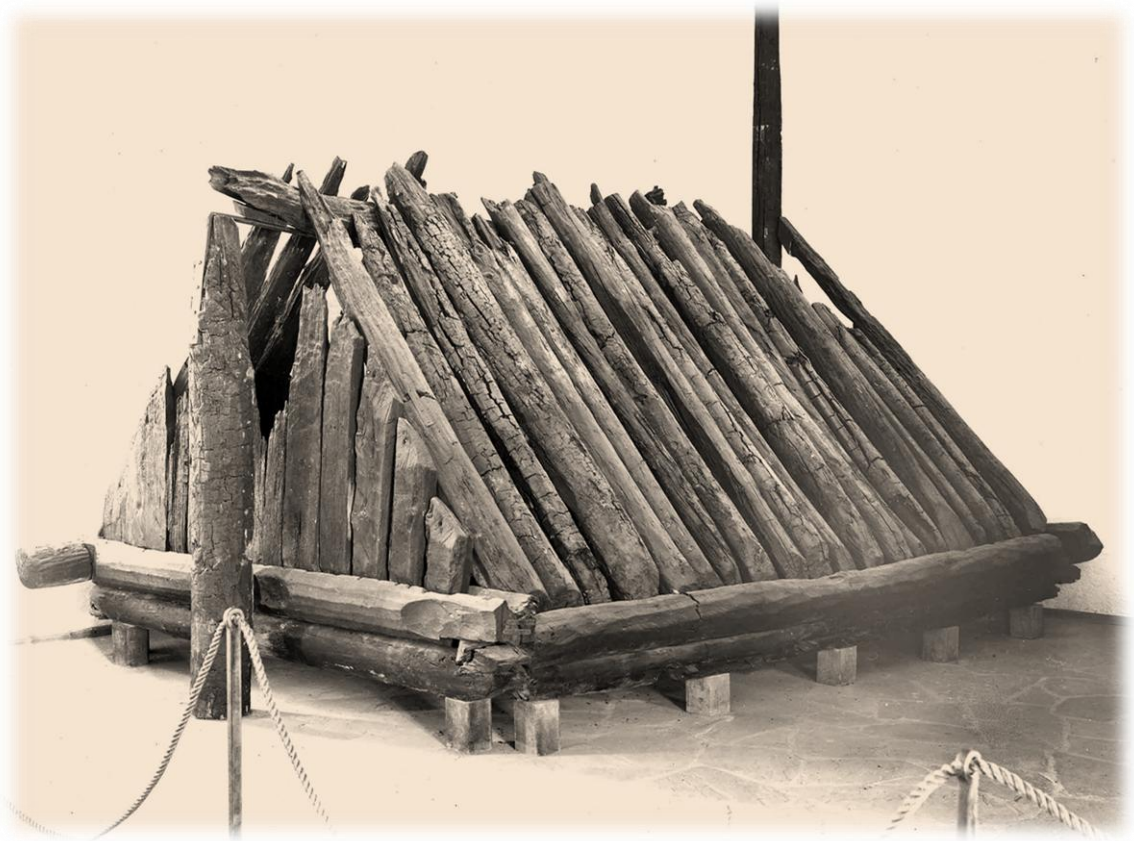
Gravkammeret fra Kongshaugen, Gokstad, opstillet i Vikingskibsmuseet på Bygdø i Oslo. Foto: L. Smestad, 1934.