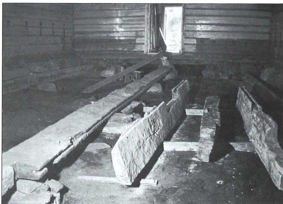
Under restaureringen av Eide kirke i 1976 ble stavkirkematerialer blottlagt under gulvet.