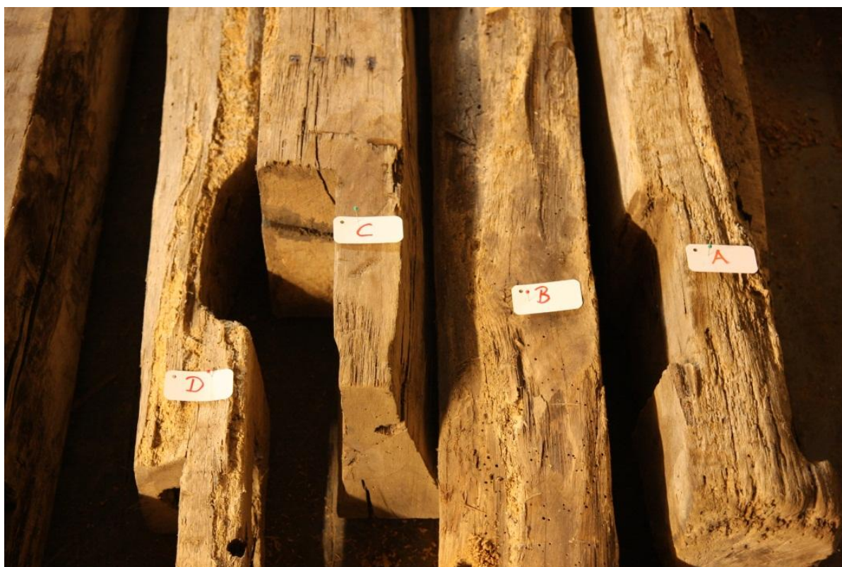
Foto 2: Genanvendte bjælker i magasin, Aust Agder Kulturhistoriske Senter.