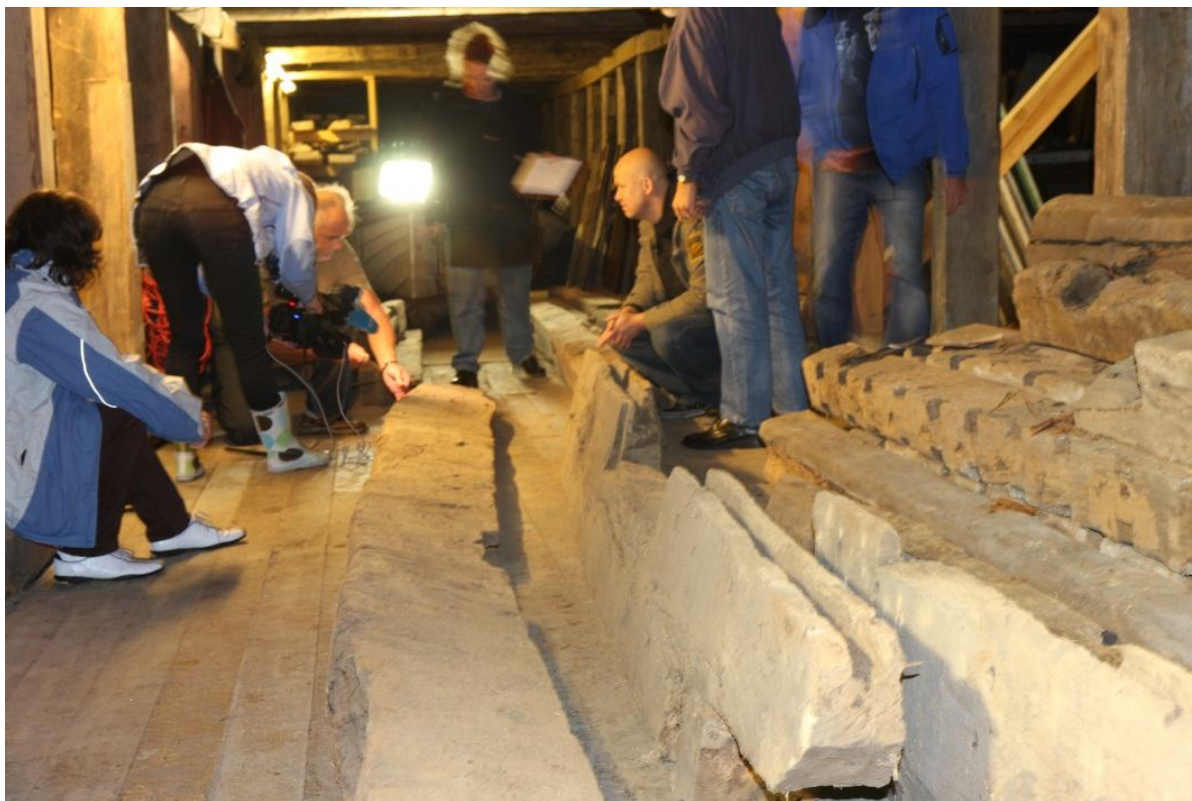
Foto 1: Udtagning af prøver i magasin, Aust Agder Kulturhistoriske Senter.