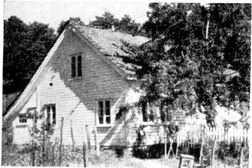
Våningshus på Hidra