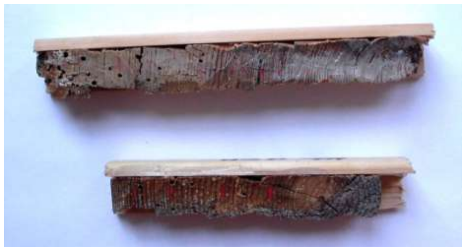
To prøver udsavet som trekanter