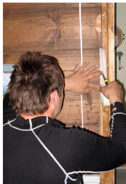
Figur 1: Klargøring til at udtage kiler fra vægen mellem stue og kammer.

Resultatet vises i Figur 2, hvor det fremgår, at den yderste årring er dateret til 1821. En tolkning af dateringsdiagrammet viser, at træerne, som prøverne stammer fra, sandsynligvis alle er fældet omkring år 1821. Dette er sandsynligvis også tidspunktet for opførelsen af nordvægen, da tømmeret traditionen tro, sandsynligvis blev brugt kort tid efter fældningstidspunktet.