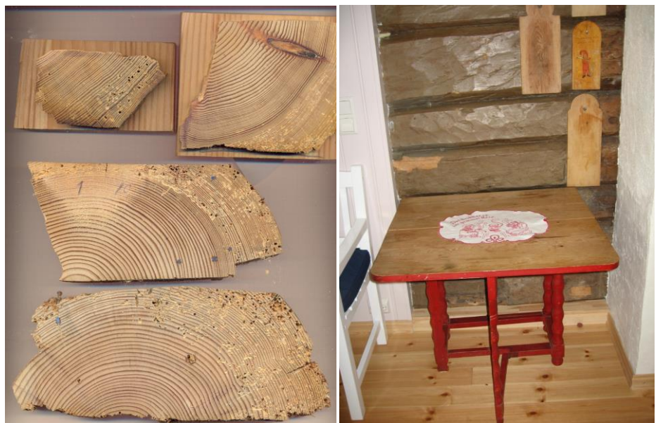
Figur 2: Venstre; del-skiver til dendrokronologisk undersøgelse. Højre; den ældste væg i vågningshuset.

Årringskurverne fra de daterede prøver (N2440019, N2440029, N2440039, N2440049, N2440069, N2440079 og N2440089) er sammenregnet til en middelkurve N24400m2. Middelkurven omfatter 145 årringe og strækker sig fra år 1687 til 1831. Middelkurven er søgt dateret med referencekurver af fyrretræ fra det sydlige Norge. I Tabel 1 fremgår det, ud fra t -værdierne, at tømmeret der er brugt til 'vågningshuset', stammer fra træer, der har vokset i området omkring Vest-Agder og Aaseral.