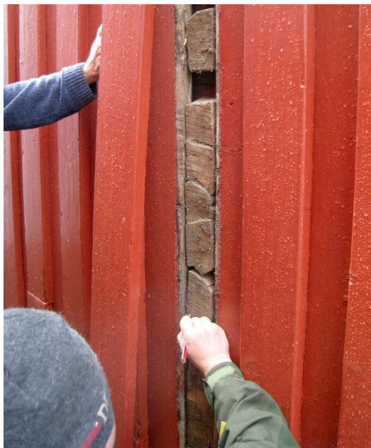
Figur 1: Udtagning af prøver, i form af kiler, fra husets yderside.

Årringskurverne for de to prøver er sammenregnet til en trækurve (N246t001), der består af 59 årringe.