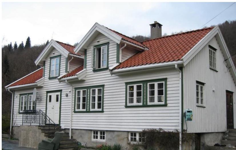
Figur 1 Våningshus beliggende i Atlaksåkeren "Hidra 22"

Prøve 1A og 1B er taget fra loftbjælke i kælderen og 2A og 2B er taget fra en overligger over ildstedet i kælderen. 1A og 1B er regnet sammen til trækurven N2580019 der omfatter 175 årringe, hvor 96 årringe er splintved. Prøverne 2A og 2B er regnet sammen til trækurven N2580029 der omfatter 65 årringe, heraf er 40 af årringene splintved. Prøven dækker perioden 1807 til 1871. Det vil sige at, overliggeren over ildstedet, stammer fra et træ der er fældet efter år 1871.