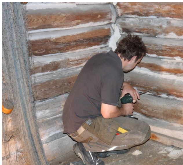
Figur 1: Boreprøver udtages fra tømmer væg, Boen gård.

Otte prøver er taget i rummet mod syd, og otte prøver er taget i gangen (væg mod rummet i nord). Prøverne omfatter mellem 23 og 95 årringe. Ti af prøverne har bevaret waldkante og 14 af prøverne har synligt splintved bevaret.