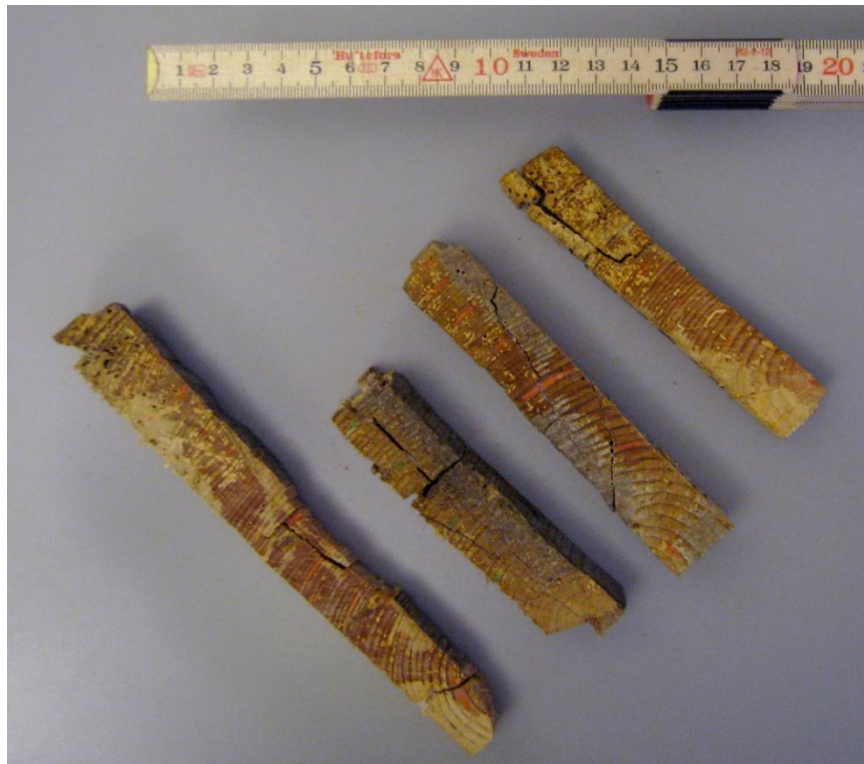
Prøver fra Kaptajn Waages hus på Hidra