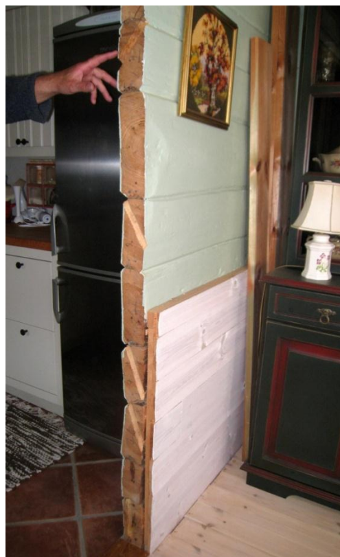
Figur 1: Dørkarmen til højre i stue 1

Alle prøver på nær prøve nr. 4 (N2370049) kan dateres (se Figur 2).