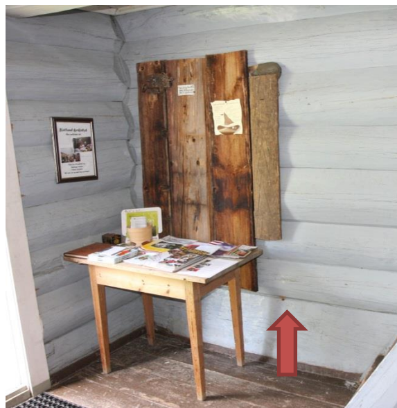
Figur 1: Rød pil angiver, hvor en boreprøve er udtaget fra syllstokker. Bordklædning af fyrretræ ophængt på vægen.

De tre prøver omfatter mellem 107 og 152 årringe. Prøverne er udtaget fra syllstokker i kirkens tårn. Ingen af prøverne har bevaret splintved. Prøverne N2510019 og N2510029 stammer fra samme træ, og årringskurverne er regnet sammen til en trækurve N251t001, der omfatter 155 årringe og dækker perioden 1388 til 1542.